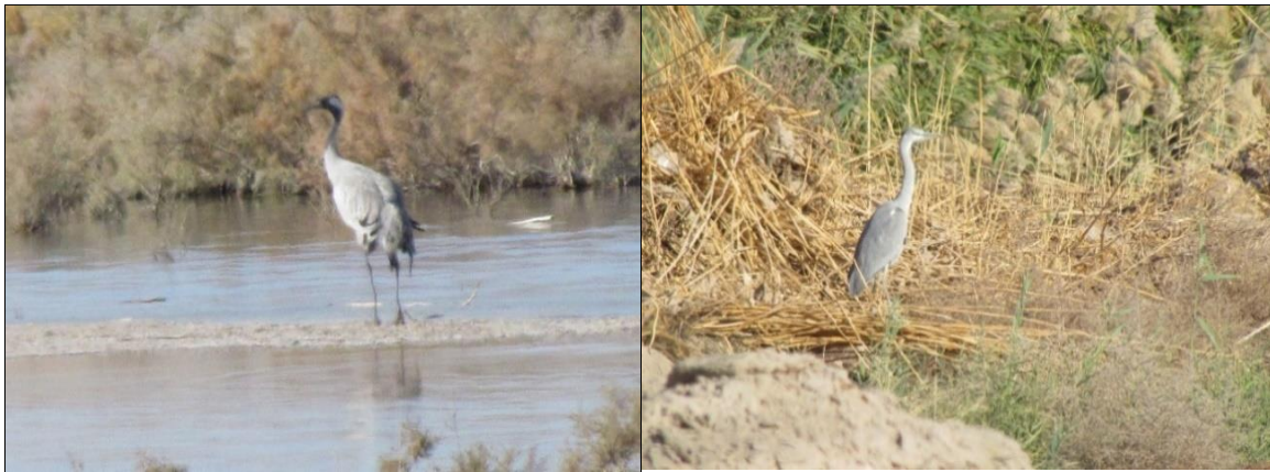
شکل ۵: تصویر ثبت‌شده درنای معمولی (سمت راست) و حواصیل خاکستری (سمت چپ) در تالاب مصنوعی یزد (نگارنده ۱۳۹۶).